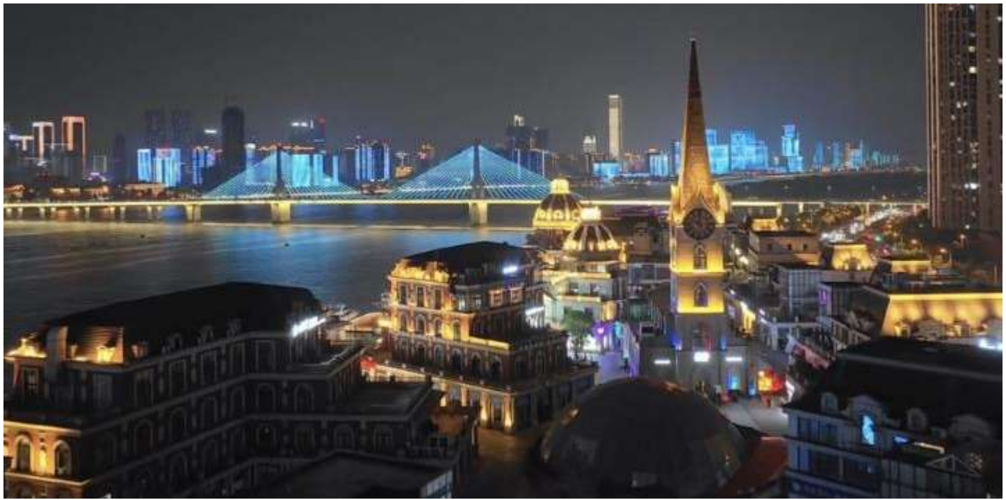
พักที่ HOLIDAY INN DAWANGSHAN HOTEL หรือเทียบเท่าระดับ 4 ดาว

นำท่านชมวิวาท่าเทียบเรือฉางชยามค้ำคืนลงทุนโดยพ่อค้าชาวเจ้อเจียงด้วยเงินลงทุน 800 ล้านดอลลาร์โดยมีเป้าหมายเพื่อสร้างโมเดลใหม่ของธุรกิจและแนะนำธุรกิจคลาสสิกของยุโรปแบบจำลองและสร้างตึกสไตล์ยุโรป รึมน้ำไม่ว่าจะมาพักผ่อน หรือมารับประทานอาหาร ความบันเทิง ที่นี้ล้วนแต่มีหมด