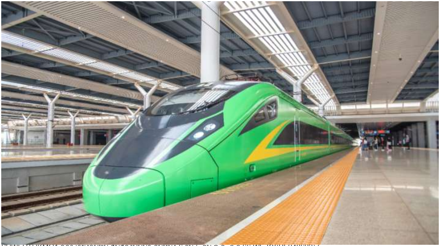
SHWEUTHKMG1 อู๋ตริ เวียงจันทน์ สิบสองปันนา คุณหมิง 6 วัน 5 คน ก.ค.-ธ.ค.66 WE-KY(RE240623)/

เช้า 🍷รับประทานอาหารเช้า ณ ห้องอาหารของโรงแรม นำท่านเดินทางสู่ สถานีรถไฟสิบสองปันนาเพื่อโดยสาร รถไฟความเร็วสูงมุ่งหน้าสู่ คุณหมิง (ใช้เวลาเดินทางประมาณ 3 ชั่วโมงทั้งนี้อาจจะมีการเปลี่ยนแปลงขบวนรถไฟหมายเหตุ : เพื่อความรวดเร็วในการขึ้น - ลงรถไฟ กระเป๋าเดินทาง และสัมภาระของแต่ละท่านจำเป็นต้องลากด้วยตนเอง จึงควรเลือกใช้กระเป๋าเดินทางแบบคันชักล้อลากที่มีขนาดไม่ใหญ่จนเกินไป