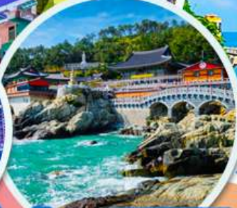
วัดแฮดง ยงกุงซา