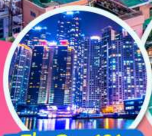
The Bay 101