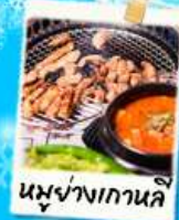
นึ่งย่างเกาหลี