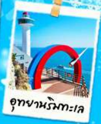
อุทยานรมทะเล