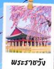
พระราชวัง