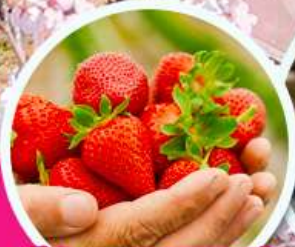
ไร่สตอร์จเมอริรี่