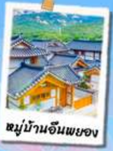
หมู่บ้านฮันพยอง