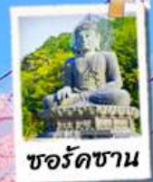
ชอรัคชาน