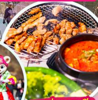
หมู่บ้านเกาหลี