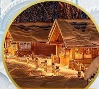
นิงเกิลเทอร์ส