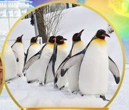
สวนสัตว์อาซาฮิยาม่า