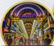
ช้อปปิ้งทานุกิโถชิ