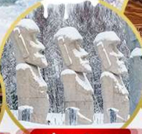
รูปปั้นหินโมอาย