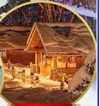
มิงเกิ้ลเกอเรส