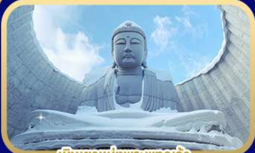
เป็นเขาแห่งพระพุทธรเจ้า