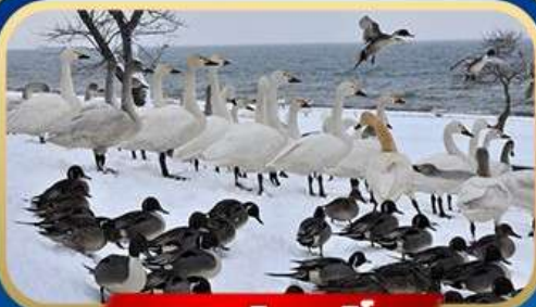
ทะเลสาบอินาวะชิโร