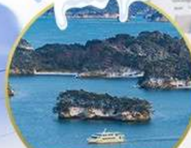
อ่าวมัตสึชิมะ