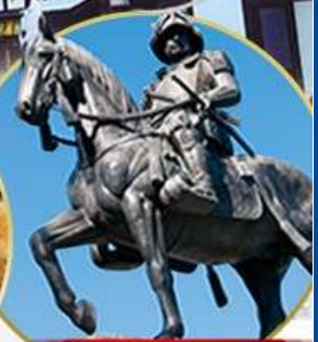
ซามูไรดาเตะ