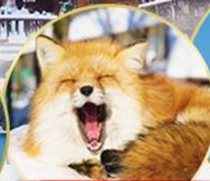
หมู่บ้านจิ้งจอกซาโอ