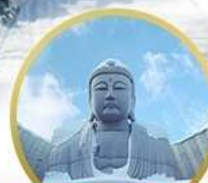
เป็นเขาพระพุทธรเจ้า