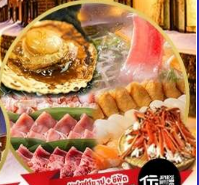
พบผัดปู 5 ชนิด อาหารมากกว่า 50 เมนู