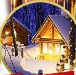
ถึงเกิลทอโรส