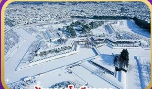
ป้อมดาวโทริยวาคาคู