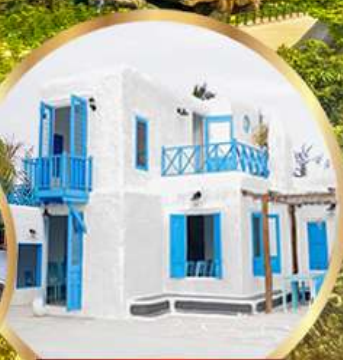
มารีน่า คาเฟ่