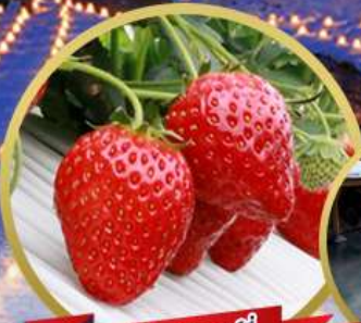
บุฟเฟ่ต์สตอเบอร์รี่