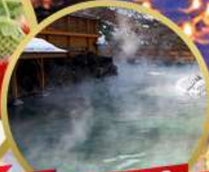
ฟักออนเซ็น 2 ถัง