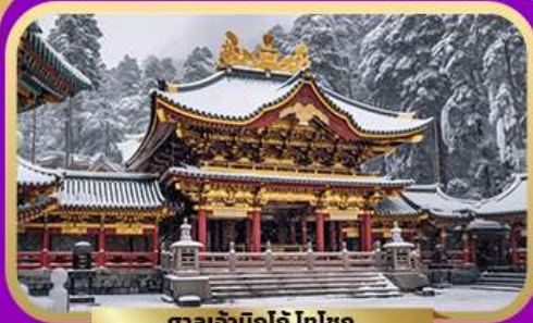
ศาลเจ้านิคโกะ ไทโชกุ