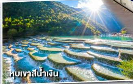
หุบเขาสีน้ำเงิน