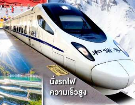
นั่งรถไฟ ความเร็วสูง