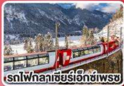
รถไฟกลาเซียร์เอ็ทซ์เพรช