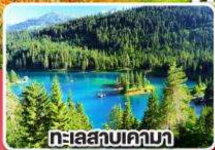
ทะเลสาบเคามา