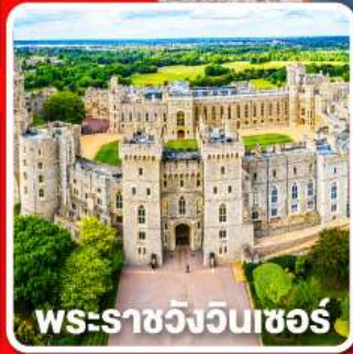
พระราชวังวินเซอร์

พักลอนดอน 4 คืนและ อิสระให้ท่านได้เที่ยวลอนดอนแบบเต็มอิ่ม 1 วัน