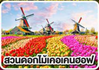
สวนดอกไม้เคอเคนฮอฟ

ดอกไม้ที่สดใส กับ หัวใจที่เปิดบาน ฝรั่งเศส เบลเยียม ลักเซมเบิร์ก เยอรมนี เนเธอร์แลนด์ 8 วัน 6 คืน