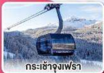
กระเช้าจุงเฟรา