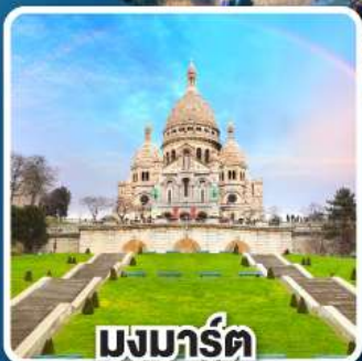
มงมาร์ต์