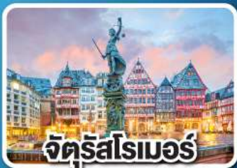
จัตุรัสโรเมอร์