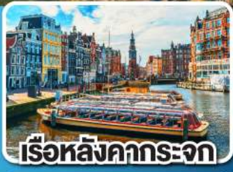
เรือหลังคากระจก