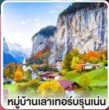
หมู่บ้านเลาเทอร์บรุนเนน