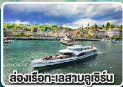
ล่องเรือทะเลสาบลูซิิร์น

เที่ยวครบเส้นทาง Jewels of Romantic Europe ของบาวาเรียและทีโรล