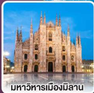
มหาวิหารเมืองมิลาน

ขึ้นกระเช้าลอยฟ้า พิชิตยอดเขากลาเซียร์ 3000