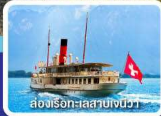
ล่องเรือทะเลสาบเจนีวา