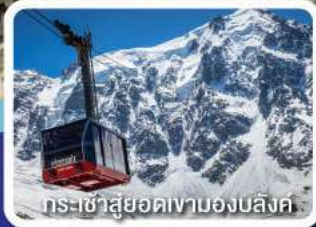
กระเช้าสู่ยอดเขามองบล็องค์