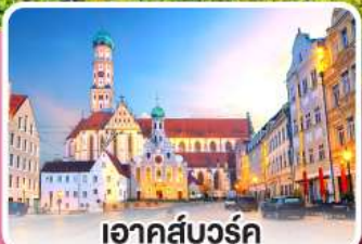
อาคส์บวร์ค