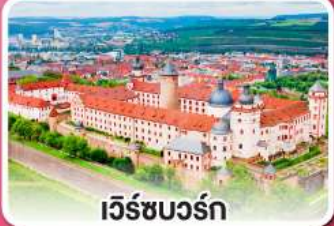
เวิร์ชบวร์ค