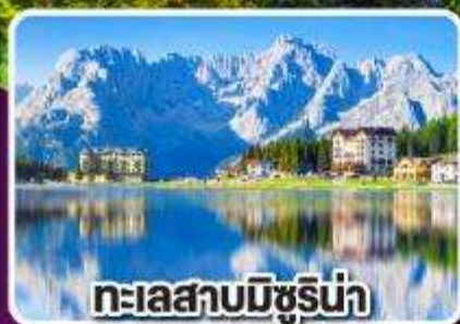
ทะเลสาบมิชูรีน่า

เข้าชม ความงามดุจดังเทพนิยาย ของปราสาทน้อยชวานสไตน์