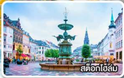
สต็อกโฮล์ม