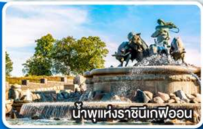
น้ำพุแห่งราชินีเฟอออน