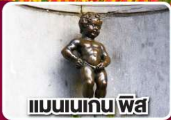
แมนเนเกน พิส