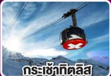
กระเช้าทิติลิส