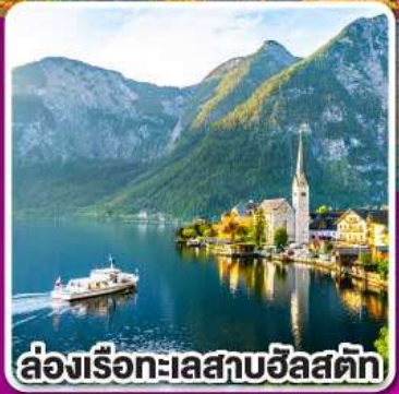
ล่องเรือทะเลสาบฮัลสตัท

พิเศษ! เมมเบอร์ชิพองดูว์ เปิดปีกกิ้ง และ ชูปัญญาช