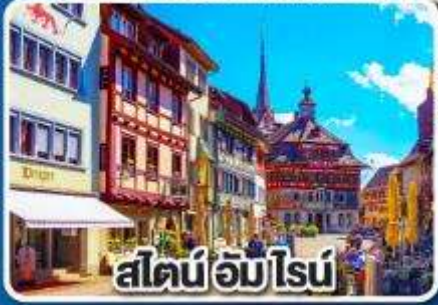
สไตน์อัมไรน์