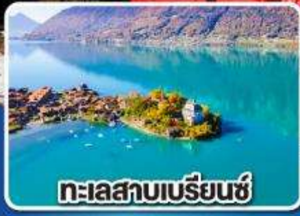
ทะเลสาบเบรียนซ์