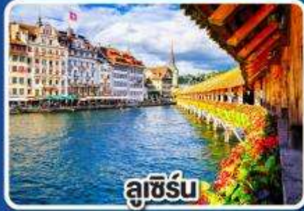
ลูเซิร์น