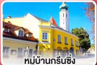
หมู่บ้านกรีนซิ่ง