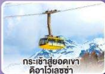
กระเช้าสู่ยอดเขา ดืออาไวเลซซา