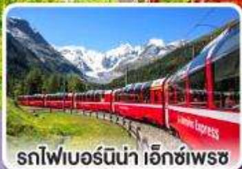
รถไฟเบอร์นีนา เอ็กซ์เพรส