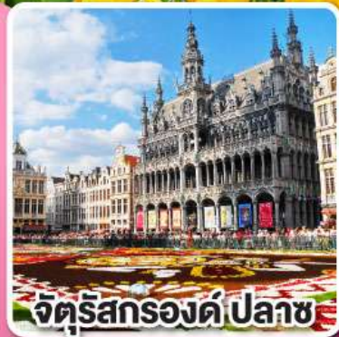
จัตุรัสกรองด์ปลาซ

ล่องเรือหลังคากระจก ชมความสวยงาม ของกรุงอัมสเตอร์ดัม