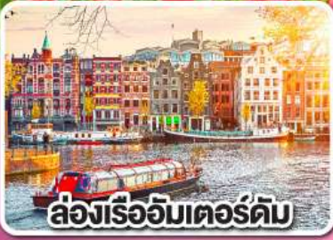
ล่องเรืออัมสเตอร์ดัม