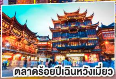
ตลาดร้อยปีเงินหวังเหมียว