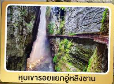
หุบเขารอยแยกอู่หลิงซาน