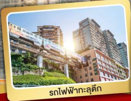
รถไฟฟ้าทะลุตึก