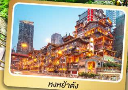
หงหย่าตัง