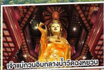
เจ้าแม่กวนอิมกลางน้ำวัดหลงหยวน