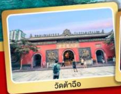
วัดต้าเจี๋ย