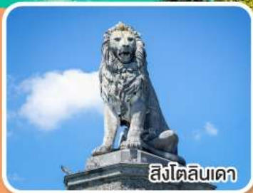
สิงโตลินเค