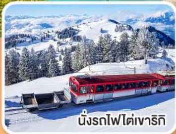
นั่งรถไฟใต้เขาริก

เข้าชมปราสาทนอยชวานสไตน์ ต้นแบบปราสาทเจ้าหญิงนิทรา