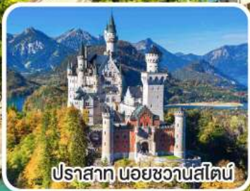
ปราสาท นอยชวานสไตน์