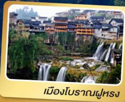
เมืองโบราณฝู่หลง

เที่ยวครบสูตร ฟู่หลง ฟิ่งหวง 6 วัน 5 คืน