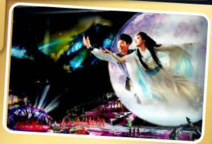
โชว์จิ้งจอกขาว