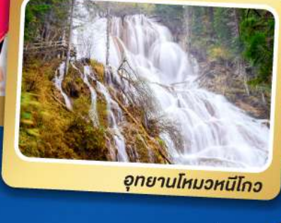
อุทยานโหมวหนีโกว