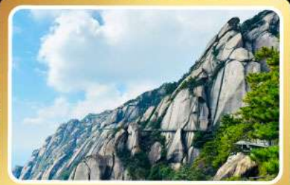
เวาหลิงซาน