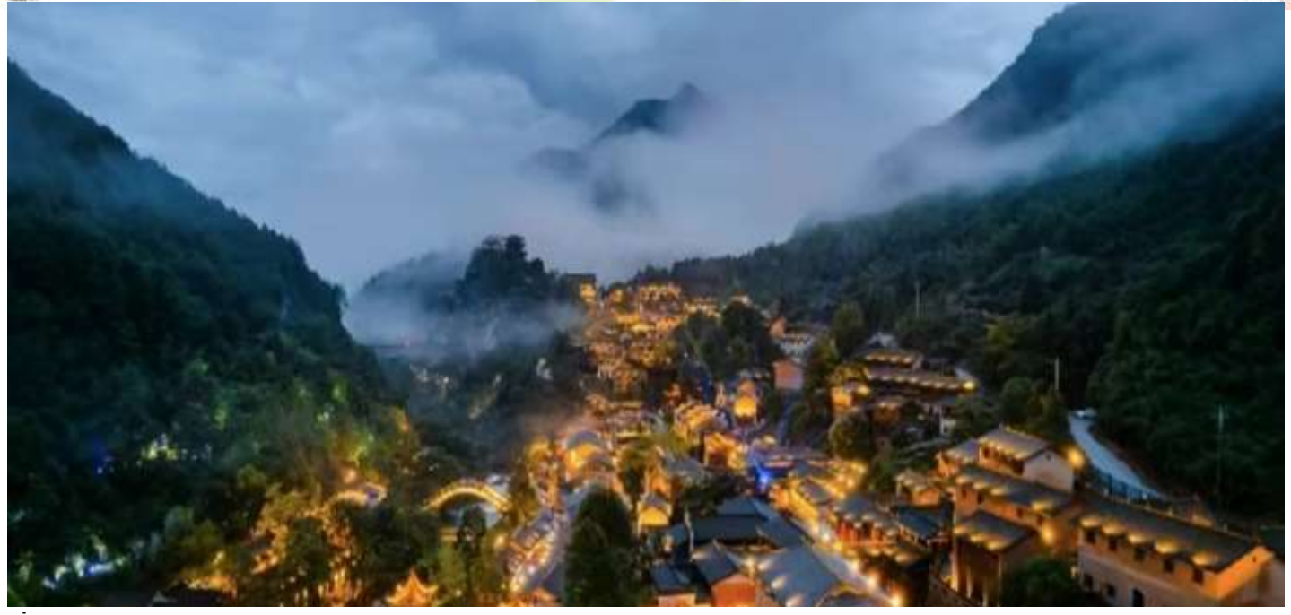
ที่พัก SHANGRAO NEW CENTURY GUANTANG HOTEL หรือเทียบเท่า 5 ดาว (มาตรฐานจีน)