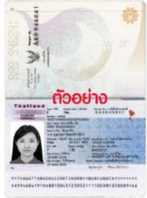
ตัวอย่าง สแกนหน้าพาสปอร์ต หน้าเต็ม 2 หน้า

2. รูปถ่ายหน้าตรง รูปถ่ายสีชัดเจน ตามขนาดจริงสำหรับทำวีซ่า (ให้ขอไฟล์รูปถ่ายจากร้านถ่ายรูปเท่านั้น) และต้องถือรูปจริงในไว้ในเดินทาง จำนวน 2 รูป