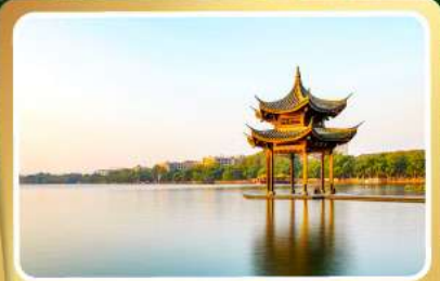
ทะเลสาบชีหู

อาหารพิเศษ อินเตอร์บุฟเฟต์ เปิดปิกนิก เต้าหู้หวงหลิง หมูตงพอ