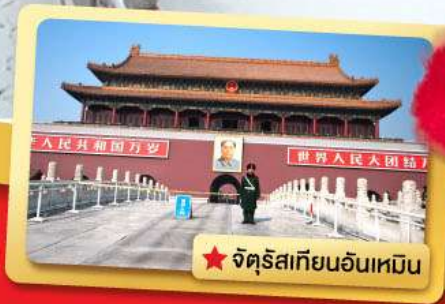
★ จัตุรัสเทียนอันเหมิน