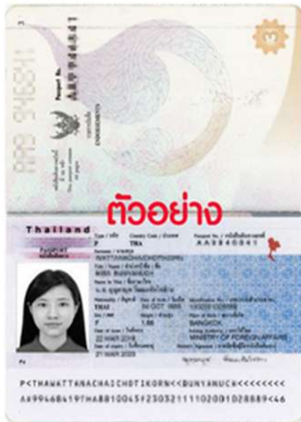
ตัวอย่าง สแกนหน้าพาสปอร์ต หน้าเต็ม 2 หน้า และรูปถ่าย 2 นิ้ว

หมายเหตุ เอกสารทั้ง 2 อย่าง ต้องสแกนหน้าพาสปอร์ต และรูปถ่ายในใบเดียวกัน (ภาพต้องชัดเจนไม่มีการบิดง)