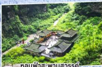
หลุมฟ้าสะพานสวรรค์