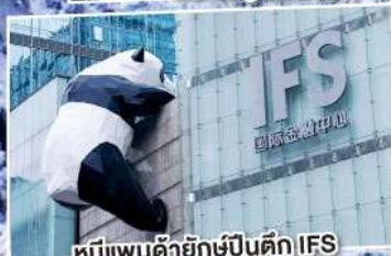
หมีแพนด้ายักษ์ปิ่นตึก IFS