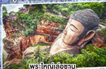
พระใหญ่เล่อซาน