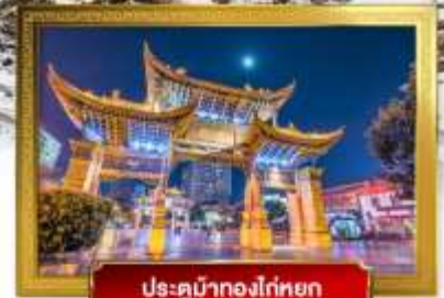
ประตูม้าทองโก่หยก