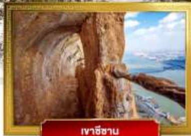
เวาซีซาน