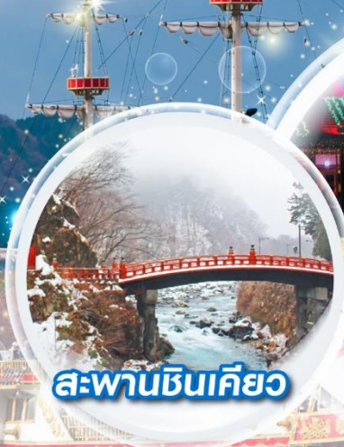
สะพานชินเคียว

◉ ช้อปปิ้งอิสระ ◉ ย่านชินจูกุ ◉ อีออนมอลล์