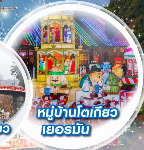
หมู่บ้านโตเกียว เยอรมัน