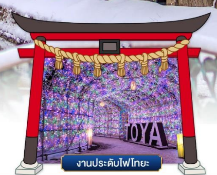
งานประดับไฟไทยะ