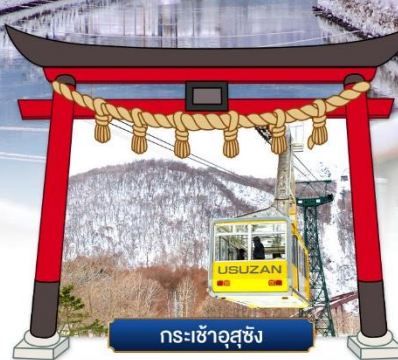
กระเช้าอูซุซัง