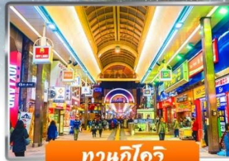
ทาวน์ชิโบริ