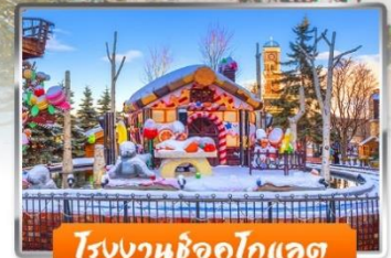
โรงงานช็อกโกแลต