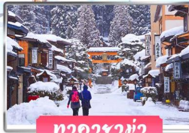
ทาคายาม่า