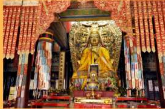
องค์องคาโป