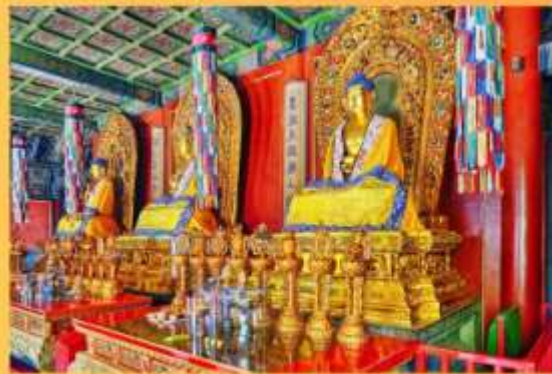
พระพุทธรเจ้า 3 พระองค์