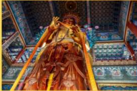
พระศรีอริยเมตไตรย