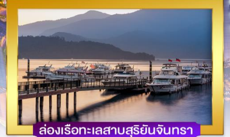
ล่องเรือทะเลสาบสุริยจีนตรา