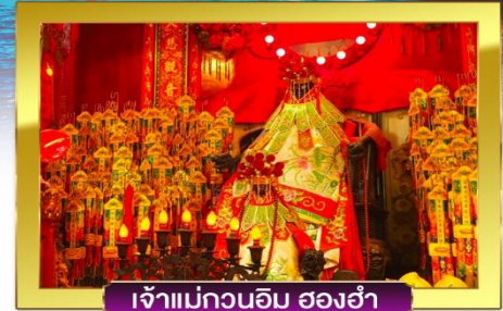
เจ้าแม่กวนอิม ฮองฮ่า