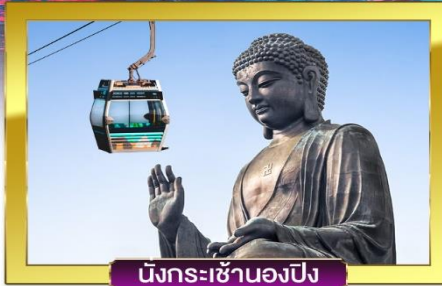
มังกรเซาฮองปิง