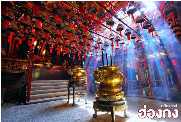
มัทศจรรย์ ฮ่องกง