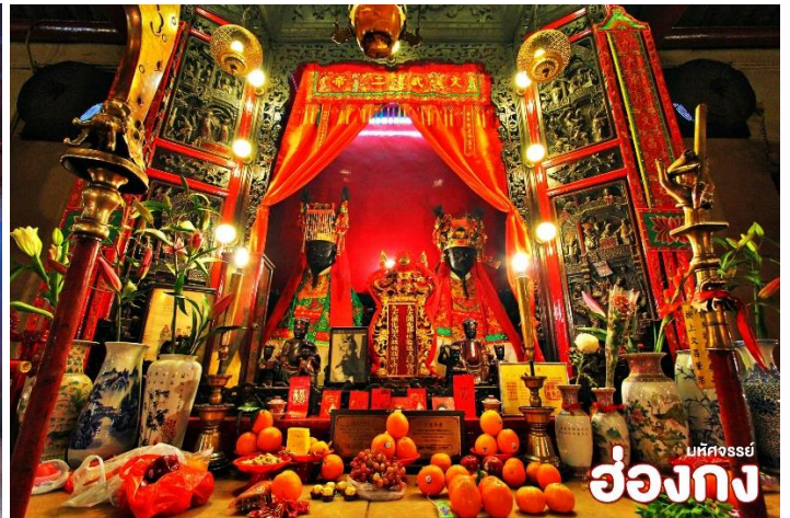
มัทศจรรย์ ฮ่องกง