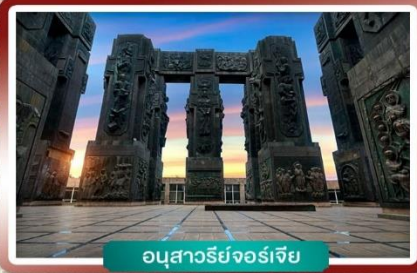
อนุสาวรีย์จอร์เจีย