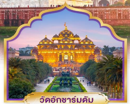
วัดอักซาร์มดัม